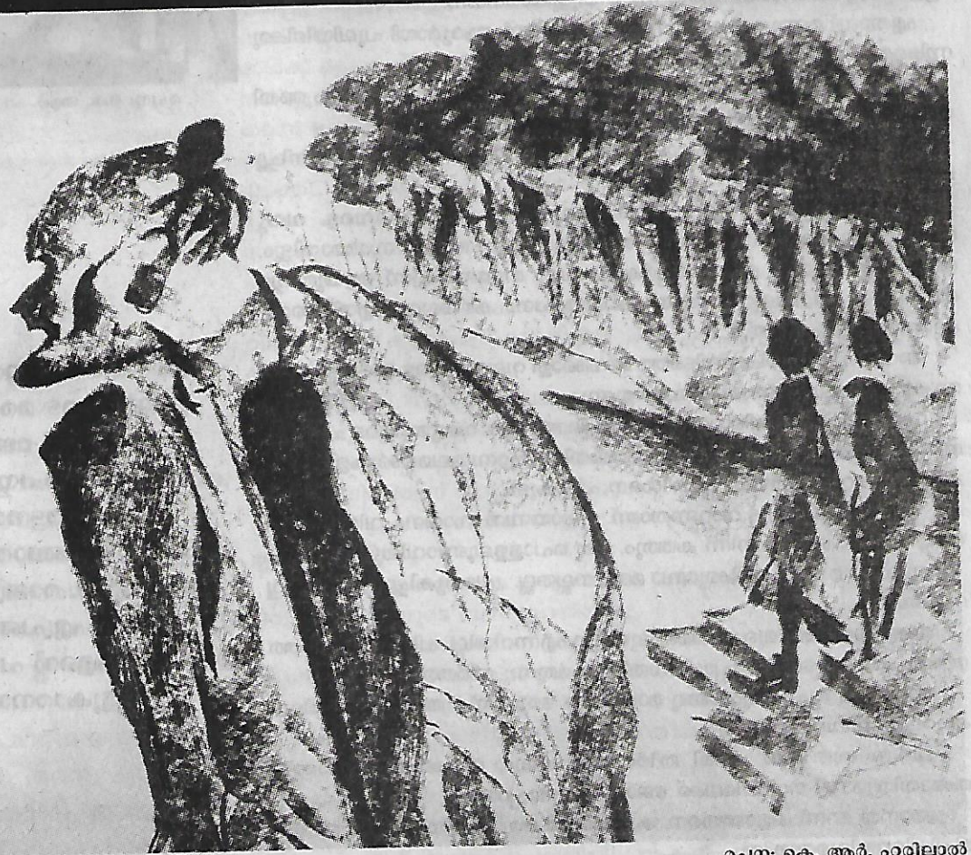
രചന: കെ. ആർ. ഹരിലാൽ

6 വാലായി കാന്നമദ്ധ്യത്തിലൂടെ ഒറ്റയടിപ്പാതയും. ഒറ്റയടിപ്പാതയിലൂടെ ഓരോ അടിയും സൂക്ഷിച്ചാവണം. ചില വഷളൻ ഒറ്റയാൻമാർ ചിലപ്പോൾ വഴി തടഞ്ഞേക്കും.