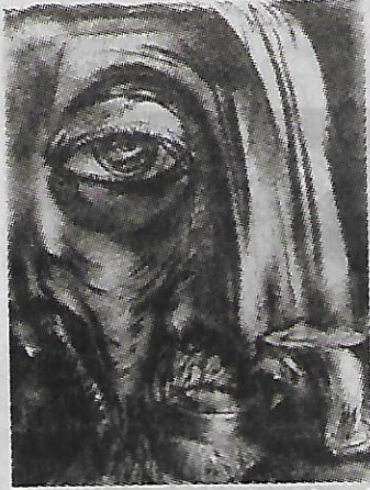
രചന: കെ. ആർ. ഹരിലാൽ

കുമാരേട്ടന്റെ മുഖത്തെ നിരാശ എന്നിലേക്കും പടർന്നു. ശരിയാണ് ചില കാര്യത്തിലേക്കിലും കലർപ്പില്ലാത്ത ആദിവാസികൾ വേണം. വെറുതേയല്ല അവരെ ആദ്യം കണ്ടപ്പഴേ സംശയം തോന്നിയത്. എന്നിട്ടും ഞാൻ ഒരവസാനശ്രമം നടത്തുകയായിരുന്നു.