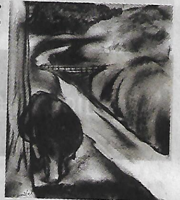
രചന: കെ. ആർ. ഹരിലാൽ

“ഇത്രേം നാളത്തെ അനുഭവം വെച്ച് നോക്കാണെങ്കി ഈ വൈദ്യത്തിൽ രക്ഷപ്പെട്ടു വരാൻ അത്രയെളുപ്പമല്ല. നമ്മുടെ നാട്ടിലാണെങ്കി എം.ബി.ബി.എസിന് കിട്ടില്ലെങ്കി ബി.എ.എം.എസ് അത്രേള്ളു പലർക്കും. ആയുർവ്വേദം എന്ന മഹാസമൃദം നീന്തികടക്കാൻ ഈ പിള്ളാരേക്കൊണ്ട് എളുപ്പമല്ല. പറ്റിയ ഒരു മരുന്ന് മാർക്കറ്റിലിറക്കിയാ അതിന്റെ പേരില് രക്ഷ