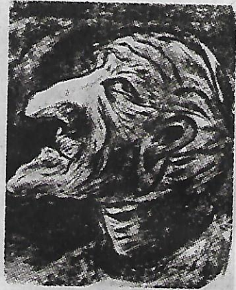
രചന: കെ. ആർ. ഹരിലാൽ

ബസ്സിലിരിക്കുമ്പോൾ മനസ്സിൽ വന്നു വീണ വഴിയോരകാഴ്ചകളുടെ ചാരതയെ അടുത്ത വർഷത്തെ ടാർജറ്റിന്റെ ഭാരം വീണു മറച്ചുകളഞ്ഞു. രണ്ടാമതും വന്നപ്പോൾ മരുന്നിനെപ്പറ്റി ചോദിക്കാനുറച്ചിരുന്നു. വലുമ്മയുടെ ശ്രദ്ധയാകർഷിക്കാൻ കൊണ്ടു വന്ന നാട്ടുവിഭവങ്ങൾ പുല്പായയിൽ നിരന്നിരുന്നു.