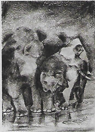
രചന: കെ. ആർ. ഹരിലാൽ

“ഇപ്പ ഇമ്മടെ നാട്ടിലെ എത്രയോ നാട്ടുവൈ ദ്യൻമാരുണ്ട്. പല വിശേഷപ്പെട്ട ഒറ്റമൂലിക ളും, യോഗങ്ങളും അവർക്കറിയാം. പഠ ഞ്ഞിട്ടെന്താ ഒരാൾക്കും പഠഞ്ഞുകൊടുക്കില്ല. പ ലപ്പോ അടുത്ത തല മുറേലൊരാൾക്ക് കൈമാറിയെന്ന് വരാം. അതു തന്നെ എത്ര കുറവാണ്. ഇങ്ങനെ നശിച്ചു പോവ്വാൻ ഈ അറിവുകൾ.